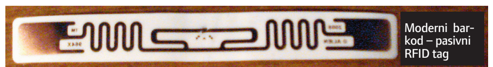
Moderni bar-kod - pasivni RFID tag

Pasivni RFID tagovi često se nazivaju modernim bar-kodovima . Naime, memorijski sadržaj je moguće mijenjati, u sekundi se može "pročitati" na desetke tagova, za njihovo čitanje nije potrebna optička vidljivost i mogu pohraniti više informacije u odnosu na standardni ID bar-kod , pa pružaju više informacija o proizvodu koji je tagiran. New York Times u jednom je članku usporedio bar-kod i RFID, a kao zaključak naveo kako