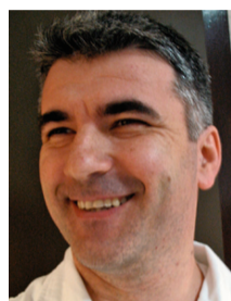
PIŠE: BOŽE KOKAN, PRIRODOSLOVNI MUZEJ I ZOOLOŠKI VRT SPLIT

Klinike diljem svijeta uvrstile su metodu liječenja rana koje sporo zacjeljuju ličinkama muhe Lucilia sericata , koje precizno uklanjaju odumrlo tkivo, uništavaju mikroorganizme, potiču rast zdravog tkiva i ubrzavaju zacjeljivanje